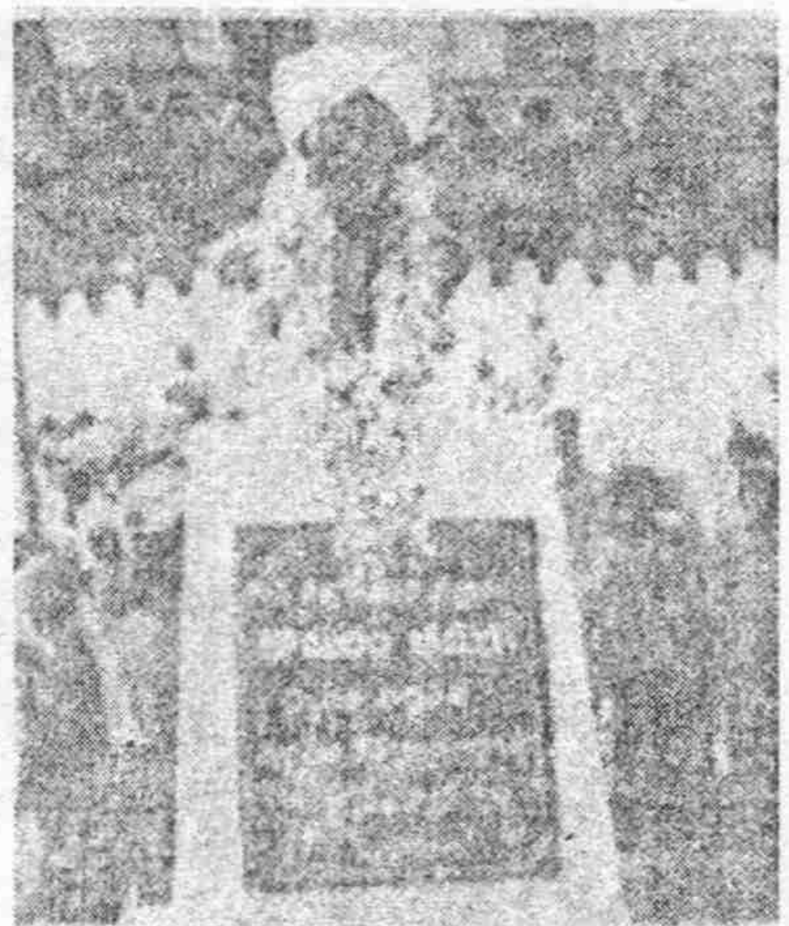
కొమురం భీము మరణించిన స్థలం, స్మారక స్థూపం