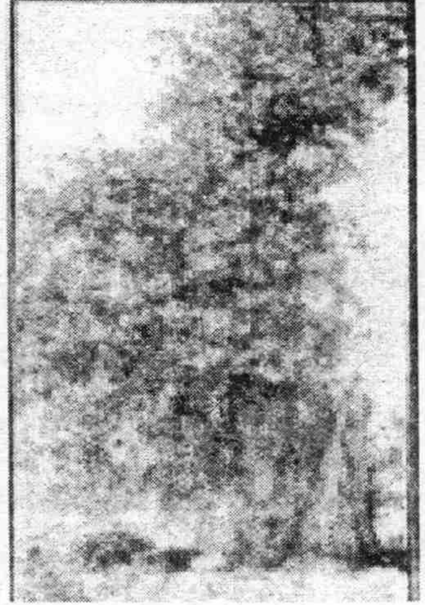
రాంజీ గోండును ఉరితీసిన ఉరులమర్రి (పులుగు శ్రీనివాస్ నవల నుంచి)

మొగలు చక్రవర్తి ఔరంగజేబు మరణం తర్వాత గోండు రాజులు మొగలులను ఢిక్కరించి కప్పం కట్టడం ఆపేసి, స్వతంత్రంగా వ్యవహరించారు. ఆ తర్వాత ఇది కొంత బ్రిటిష్ ప్రత్యక్ష ఏలుబడిలోనూ మరికొంత నైజాం రాజ్యంలోనూ ఉన్నట్లు తెలుస్తున్నది. బ్రిటిష్ నైజాం ప్రభుత్వాలపై సాగిన 1860ల నాటి రాంజీ గోండ్ తిరుగుబాటు ప్రభావం కొమురం భీము ఉద్యమం మీద ఉందని చెప్పవచ్చు.